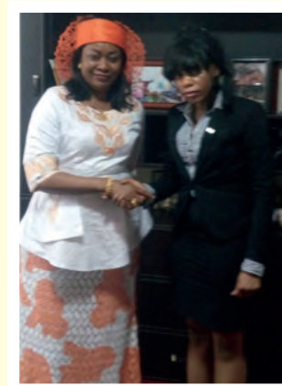
Treffen und Gespräch mit der Frau des Präsidenten von Guinea/Conakry Jeanne Alpha Condé

Viele Kinder haben keine Bücher oder Schreibmaterial.