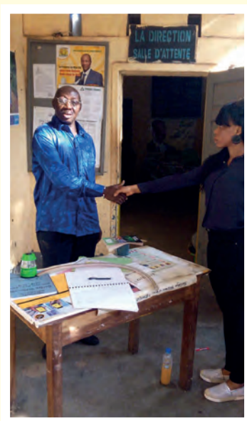
Büro eines Grundschulleiters in Conakry